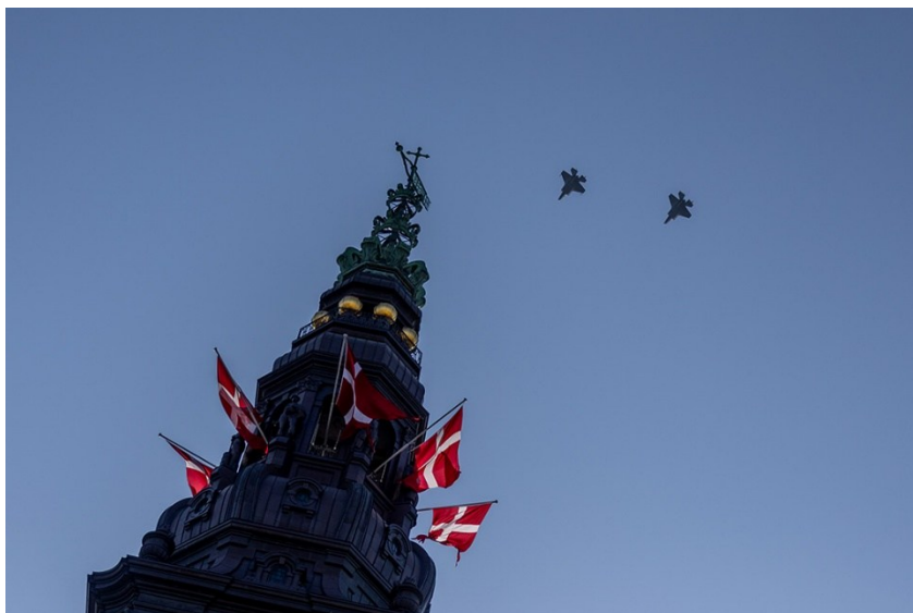
Danske F-35-kampfly flyver over København.