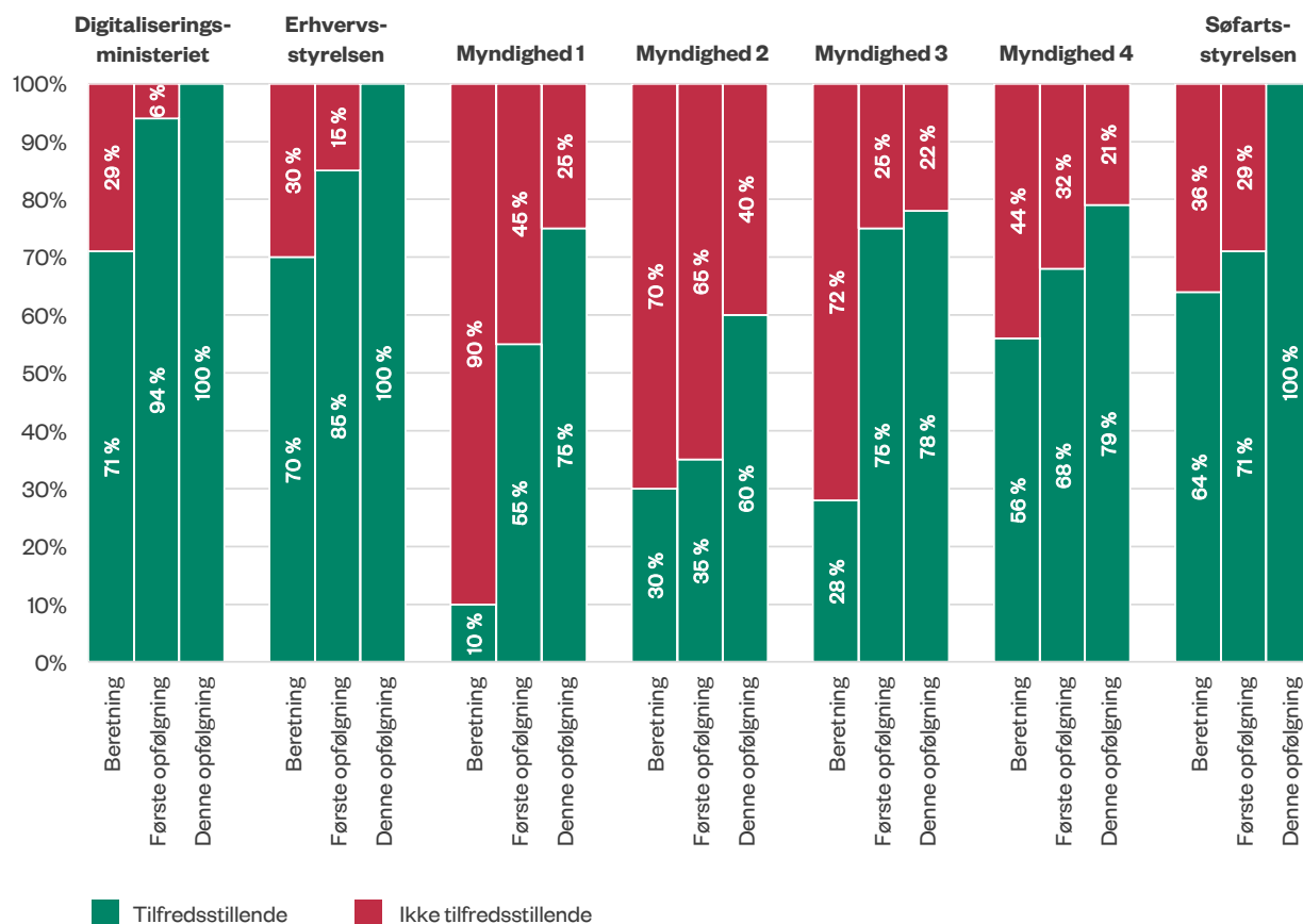
Figur 2 Status på forbedring af myndighedernes it-beredskab

Note: Tallene er baseret på antallet af punkter, som myndighederne skal leve op til. Vi har vægtet punkterne ligeligt. Punkterne er vurderet tilfredsstillende, hvis de er opfyldt. Hvis de er delvist eller ikke opfyldt, er de vurderet som ikke tilfredsstillende.